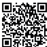
Ficha de Inscripción