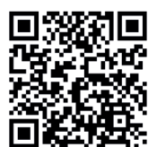
Ingresas al simulador de pago